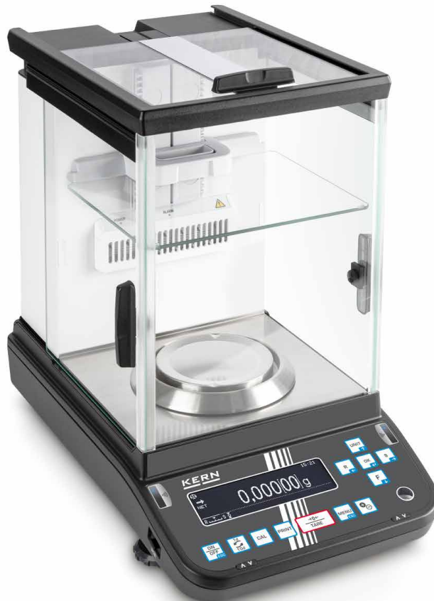
KERN ABP-A avec ionisateur intégré et chambre de protection interne

Chambre de protection interne - minimise l'effet des flux d'air dans la chambre de pesée, uniquement pour les modèles 0,01 mg de la série ABP-A